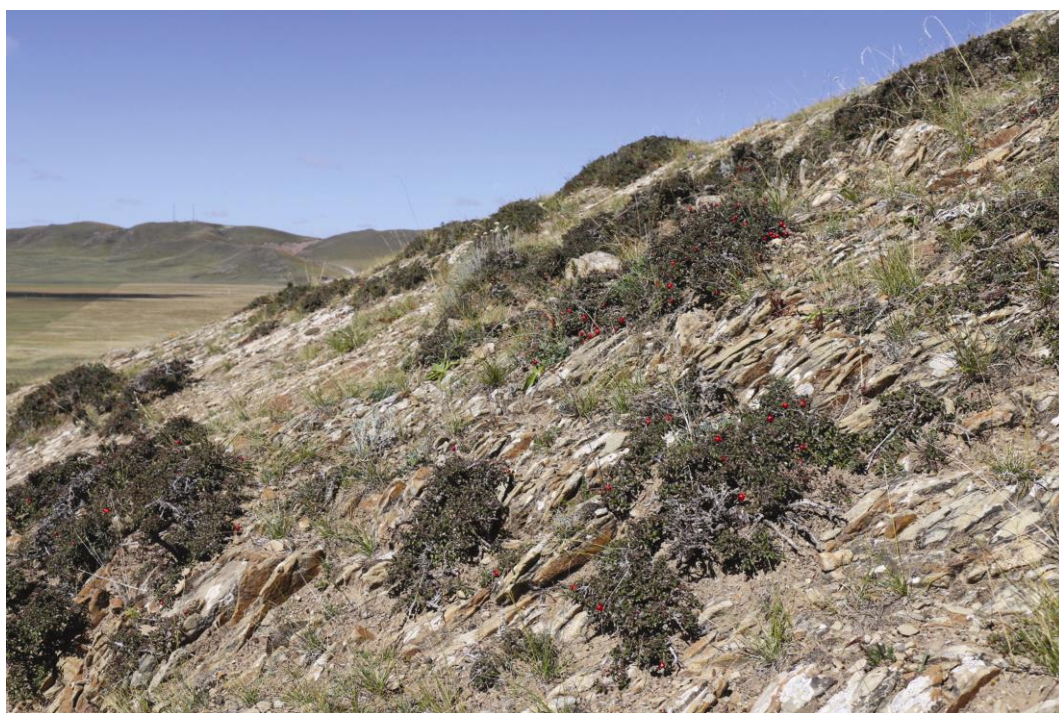
图 2 阿拉善蝮生境