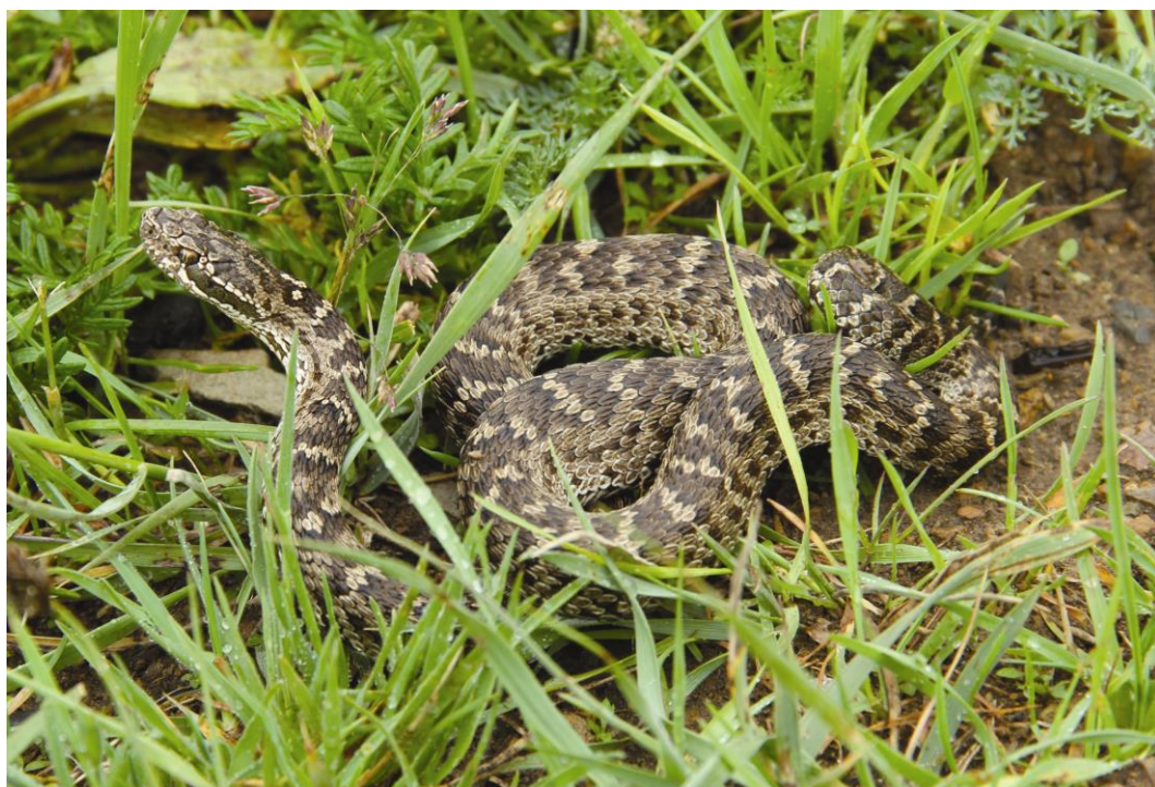
图 1 发现于四川省若尔盖县的阿拉善蝮