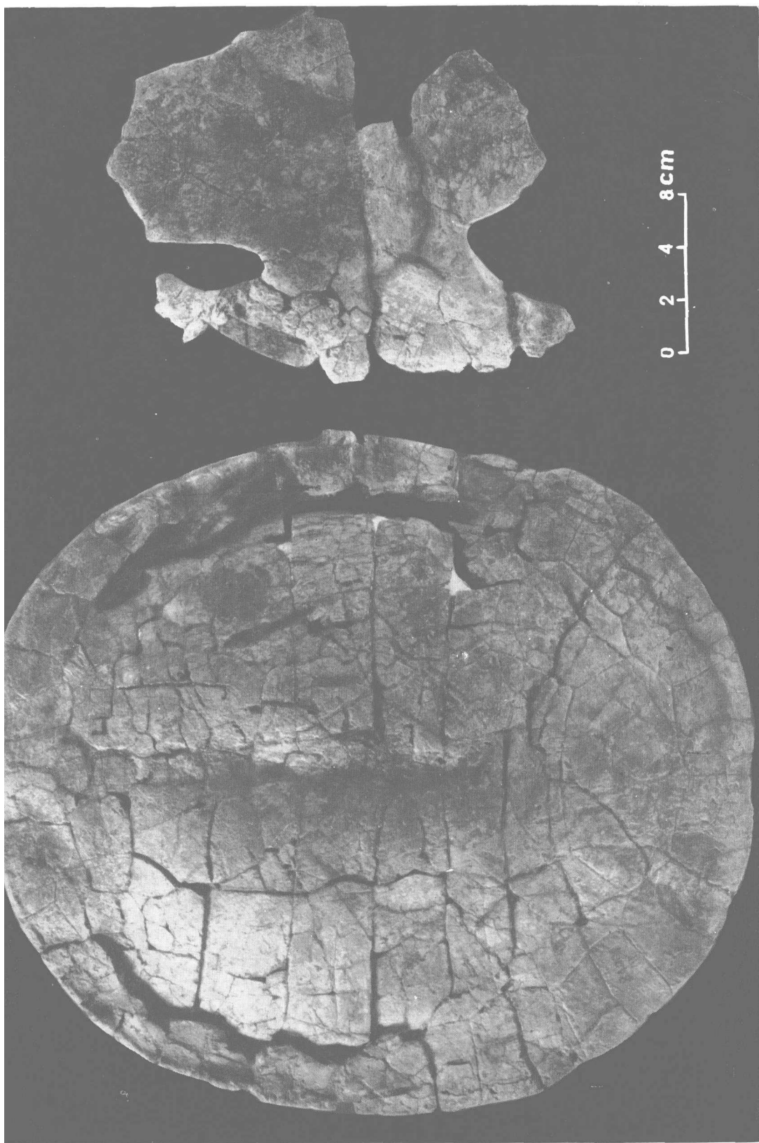
准噶尔新疆龟, 新属, 新种, V7648.

( Xinjiangchelys junggarnensis , gen. et sp. nov.)