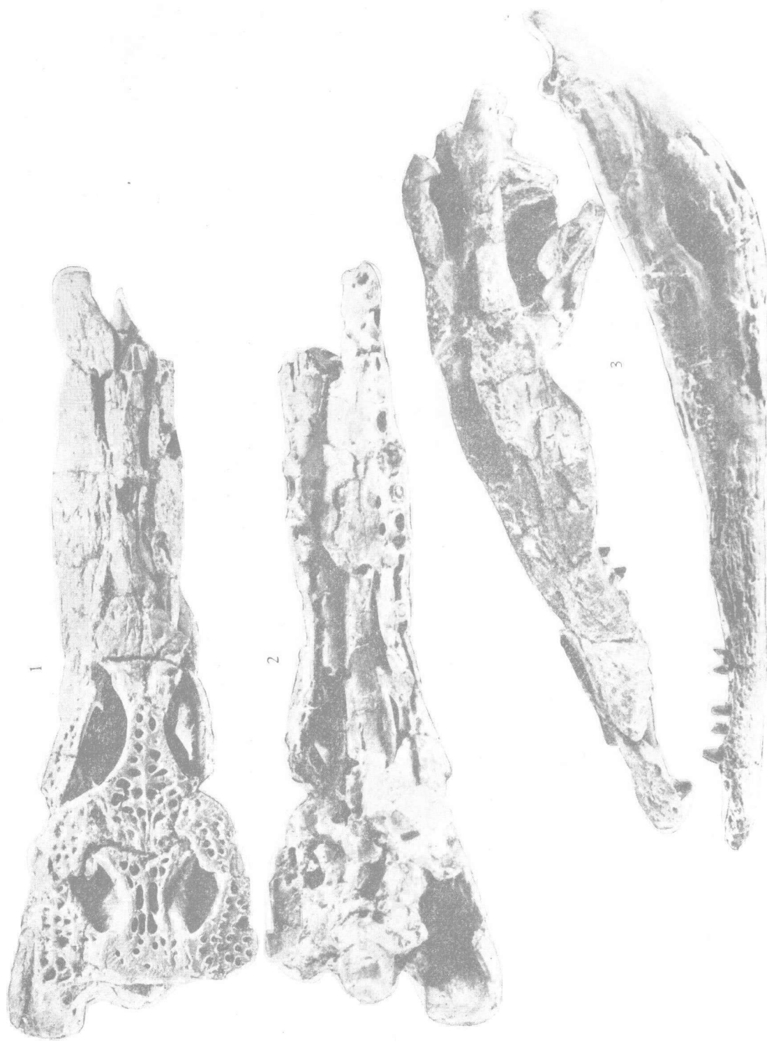
衡东平顶鳄 Planocrania hengdongensis sp. nov. 头骨及下颌×1