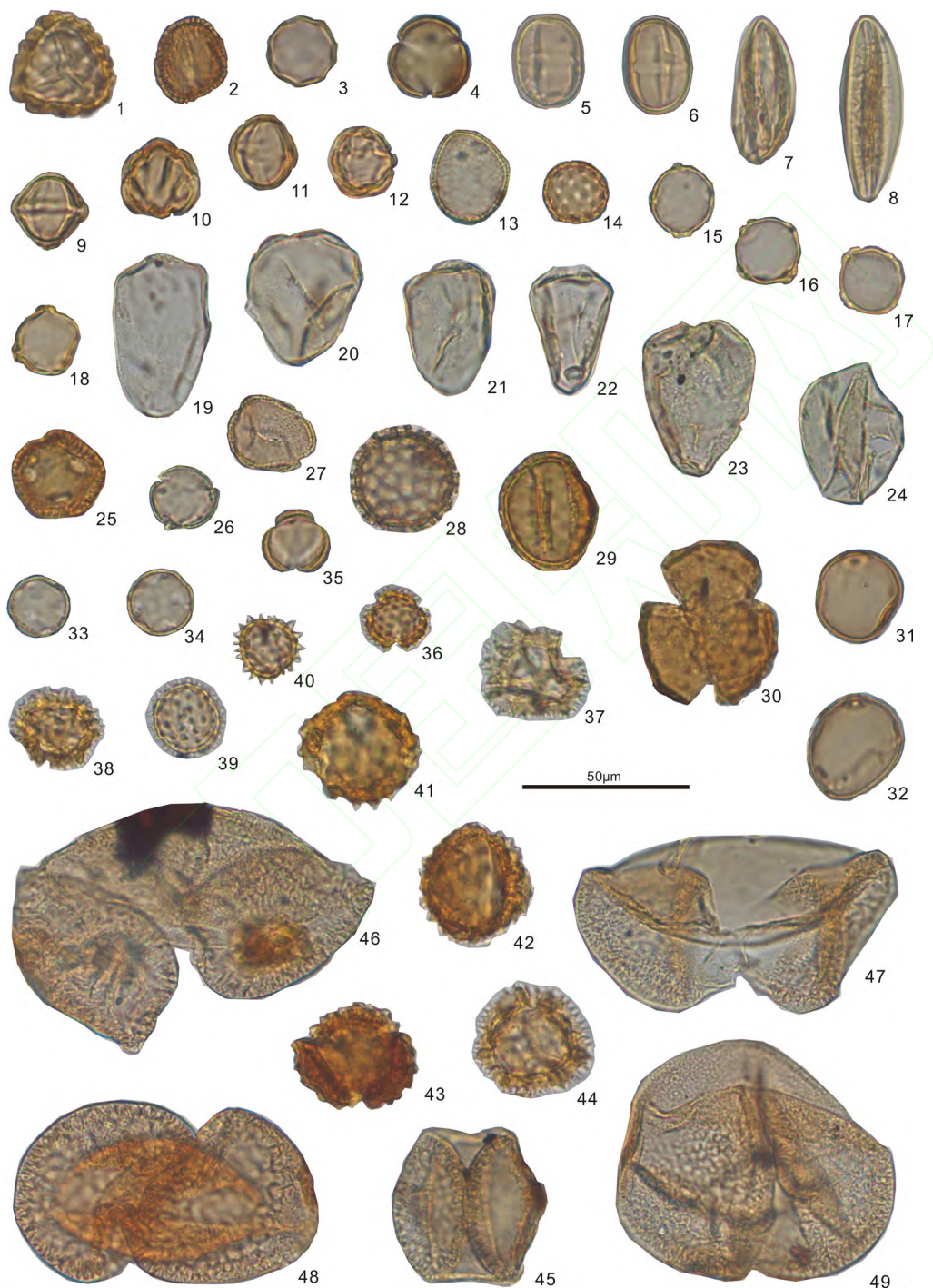
图2 英贤村剖面孢粉图版