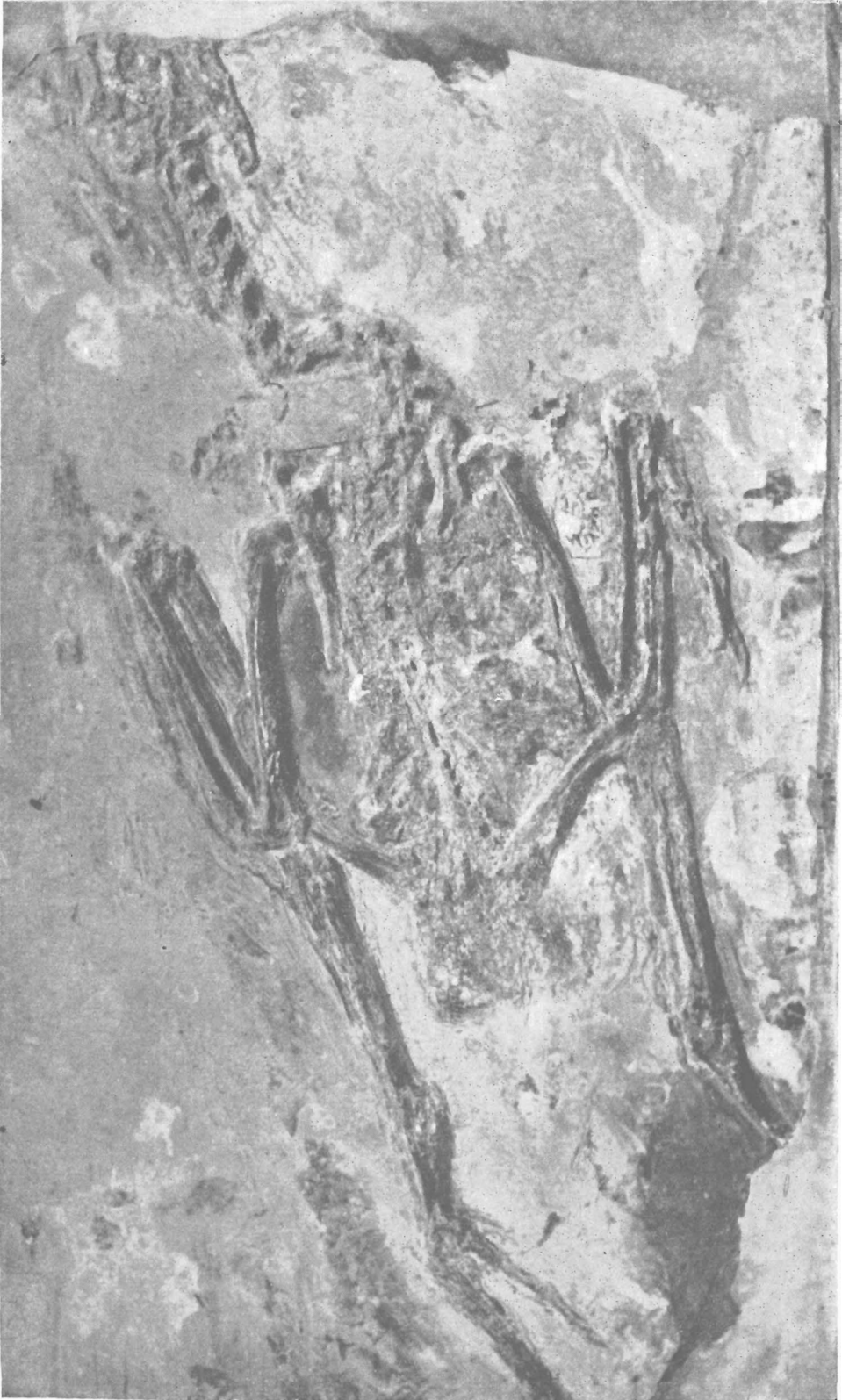
硅藻中华河鸭, 新属, 新种。Ca. \times 1/2 。 ( Sinonas diatomus , gen. et sp. nov.)