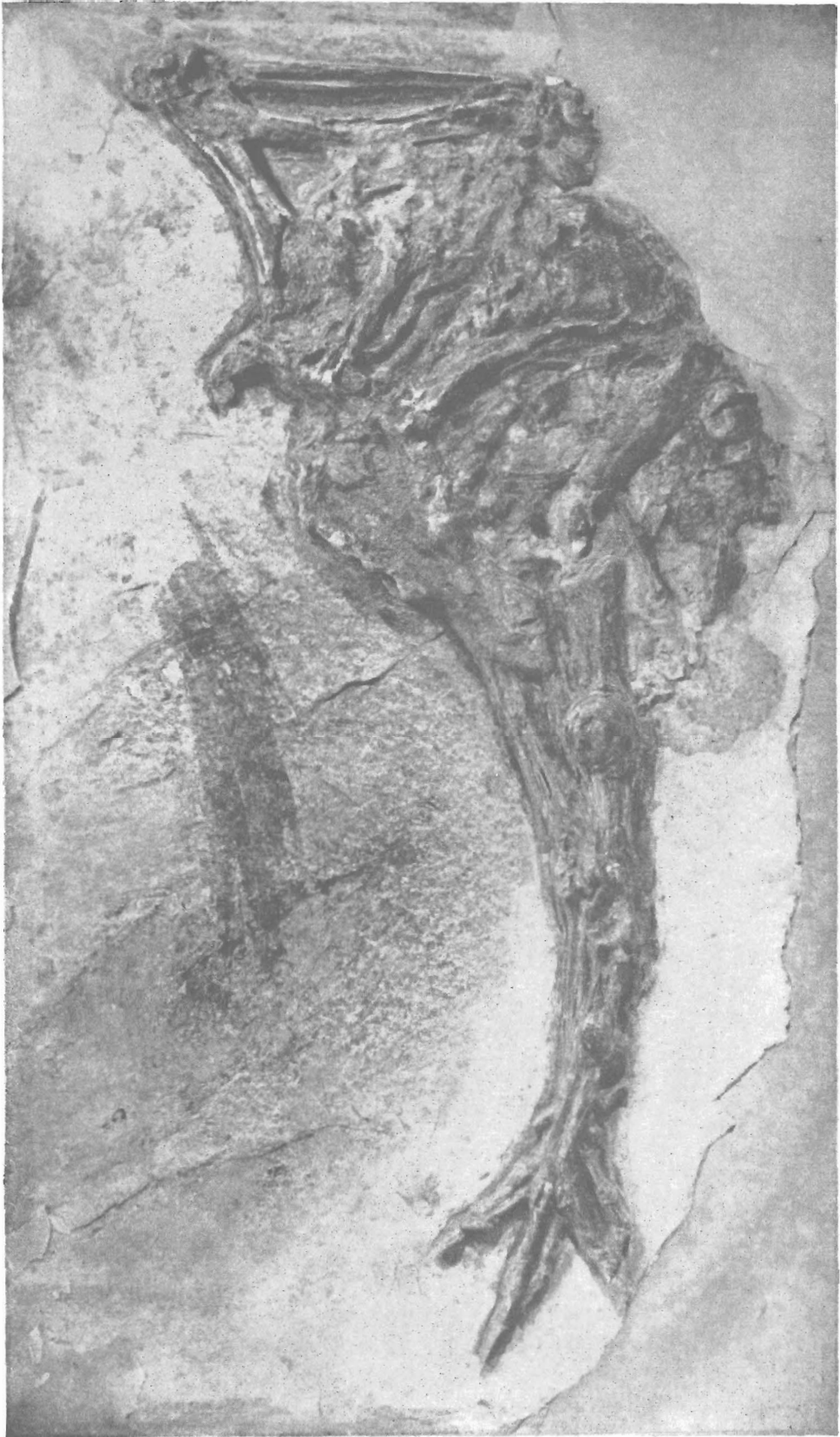
硕大临朐鸟、新属、新种。Ca. X1/3.5 ( Linquornis gigantis gen. et sp. nov.)