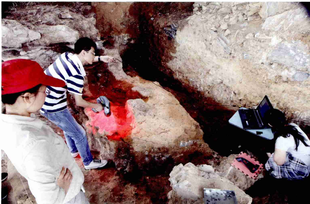
图 2 发掘期间在现场记录、提取用火证据