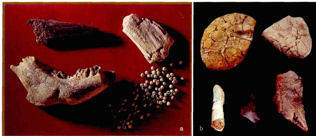
图 1 在周口店发掘早期发现的烧骨与炭化的朴树籽 (a) 和烧石 (b)