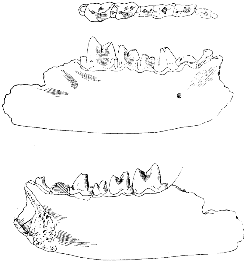
图1 Pterodon dahkoensis (sp. nov.)

右下颌骨,带有 P_1-M_3 。上图,顶面及外侧面;下图,内侧面视。×1/2。