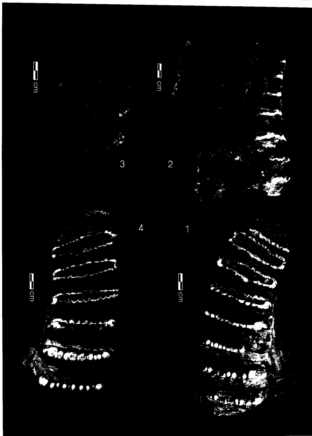
图版 1 东方剑齿象