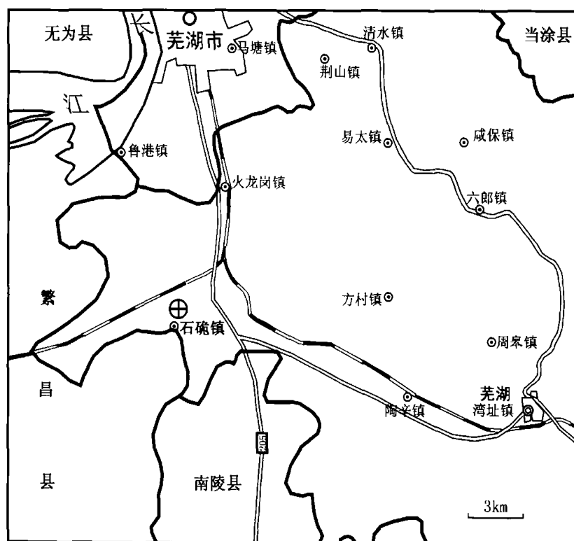
图 1 金盆洞旧石器地点的地理位置图

其地理坐标为北纬 31^{\circ}13.2' , 东经 118^{\circ}23' 。2001 年 8 月份, 当地高山小学杨先荣老师在陶家山采石场发现一些动物化石, 并向有关部门作了汇报, 同年 10 月份, 安徽课题组金昌柱、郑龙亭、刘金毅等在接到芜湖县文物管理所谢小成所长转来的线索后, 到现场进行调查, 并采集了若干哺乳动物化石和一件可疑的石制品。2002 年 5 月本项目负责人高星以及张森水研究员等前往考察并确定在本年度内对该化石地点进行试掘。按照预定工作安排, 中国科学院古脊椎动物与古人类研究所金昌柱、刘武研究员率领课题组赴金盆洞旧石器地点, 并于 2002 年 10 月 7 日至 2002 年 11 月 12 日对化石地点进行了试掘。参加发掘工作的有中国科学院古脊椎动物与古人类研究所刘金毅、崔宁、张颖奇, 安徽省博物馆郑龙亭、安徽省文物考古研究所韩立刚、芜湖县文物管理所谢小成、丁方谊、陈尚前等同仁共 10 人。