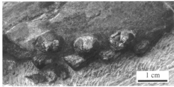
图2 双列齿凹棘龙(ZMNH M8804)上颌骨牙齿(左为前) Fig. 2 Maxillary teeth of Concavispina biseridens (ZMNH M8804), anterior to the left