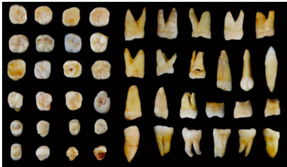
图 1 在道县发现的 47 枚人类牙齿化石

福岩洞堆积物地层清晰，可以明确划分为四层，地层在整个洞穴延伸连接并可直接对比，人类化石及动物化石均发现于第二层。人类牙齿和动物群化石在洞内的分布区域较大、层位明确，延伸范围达 40 余米。在整个发掘期间，研究人员对出土人类化石区域的地层顺序进行了细致勘察，确定人类化石及动物化石埋藏后未受扰动。系统采集了测年样