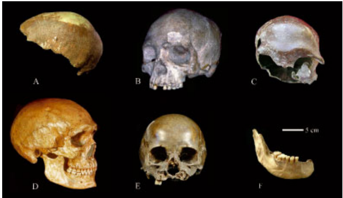
图2 本文涉及的部分更新世晚期人类头骨和下颌

柳江：吴汝康认为柳江人是正在形成中的蒙古人种的一个早期类型，但还头骨还保留一些原始特征 [25] 。近年本文作者对柳江人头骨、骨盆、脑形态的研究 [26-28] 显示柳江人虽然保留有少量常见于更新世晚期人类的原始特征，但头骨的绝大多数特征位于现代中国人的变异范围。与其他中国更新世晚期人类，尤其是山顶洞人头骨相比，柳江人显得要现代的多。柳江人骨盆整体特征纤细，各部位尺寸都较小，尤其代表肢体最大宽度的骨盆宽小于大多数更新世人类，常见于更新世中、晚期人类（包括尼安德特人）骨盆的一些主要特征在柳江人骨盆均未有出现，而柳江人整体骨盆及其各组成部分的形态特征及尺寸比例都与现代人接近。柳江人的颅容量为 1567 mL，位于晚期智人的变异范围而远大于现代人的平均值。柳江人脑的枕叶后突程度较现代人显著、小脑半球较现代人收缩，其脑的发育程度与晚更新世晚期人类最接近。这些研究发现说明柳江人在形态进化上与现代中国人已经非常接近。